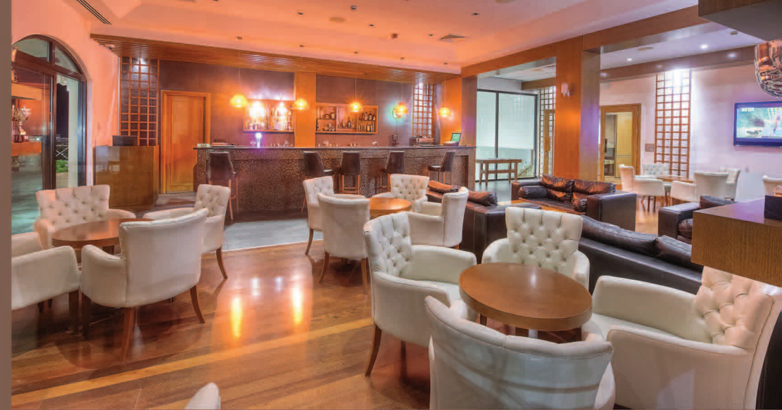
Shanks Bar (Academy Gebäude)